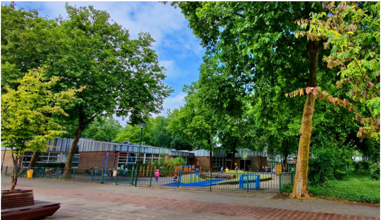
Datum: 16 juli 2024